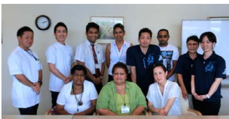
中頭病院での研修