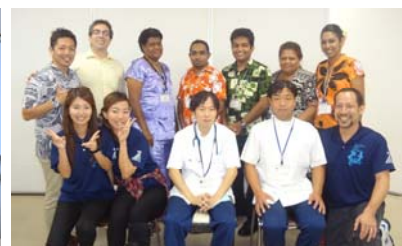
沖縄リハビリテーションセンター病院での研修