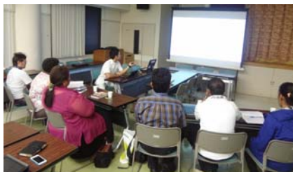
那覇市立病院での研修

残りの2週間(8月18日～29日)は理学療法士2人の研修員が残り、評価実習を中心に研修を進めていく予定です。各研修施設のスタッフのみなさん宜しくお願い致します。（国際支援部）