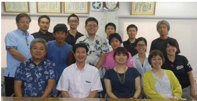
参加メンバーとスタッフ