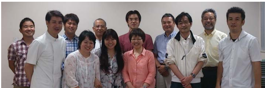
【地域包括ケア推進委員】

2025年（平成37年）を目途に、重度な要介護状態となっても住み慣れた地域で自分らしい暮らしを人生の最後まで続けることができるよう、住まい・医療・介護・予防・生活支援が一体的に提供される地域包括ケアシステムの構築（厚生労働省）に向けて、具体的な事業が始まりました。