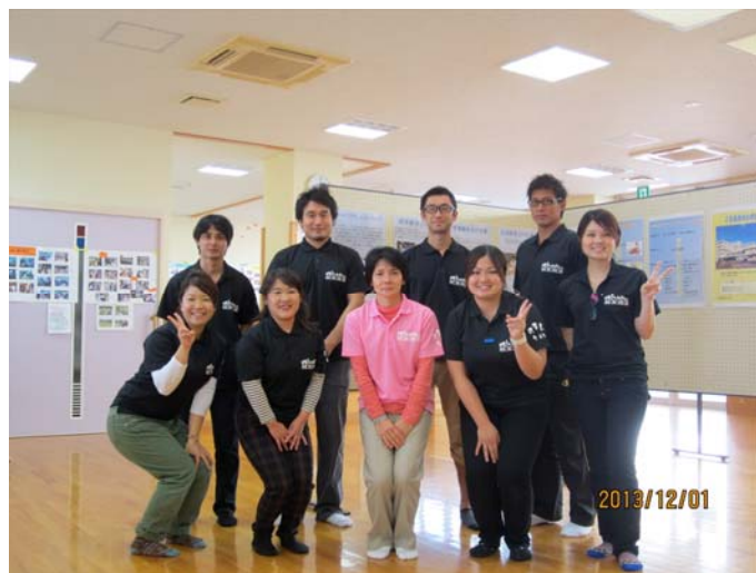
八重山ブロックメンバー