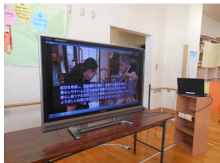
理学療法ビデオ上映コーナー