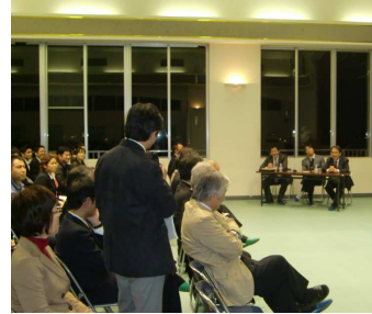
参加者とのディスカッション