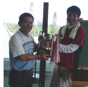
優勝トロフィー授与