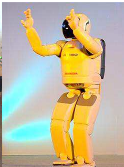
カチャーシーをする ASIMO