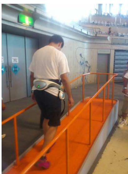
リズム歩行アシスト

リズム歩行アシスト 【Honda HP : http://www.honda.co.jp/ASIMO/new-tech/rhythm/ 】